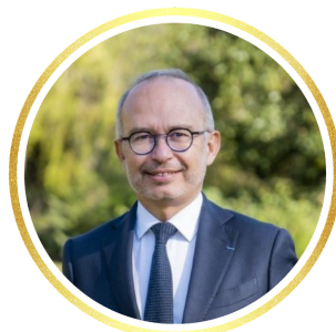
Lionel ROYER-PERREAUT Député des Bouches-du-Rhône Conseiller municipal Conseiller métropolitain

Je suis heureuse de pouvoir vous proposer une programmation riche sur l'ensemble de nos maisons de quartiers. Je souhaite que petits et grands puissent se rassembler dans ces lieux chaleureux et profiter, ensemble, de moments de convivialité.